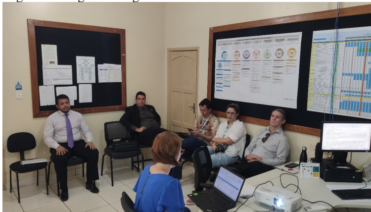
Figura 01: Registro fotográfico da 6ª Reunião Ordinária da CPMAPD