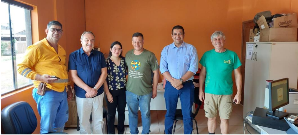
Foto 4 Visita administração Regional