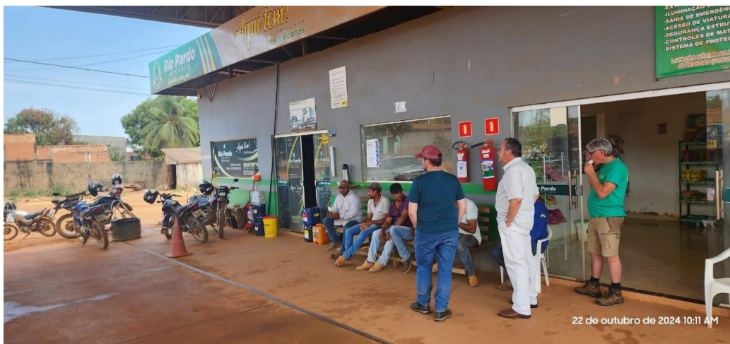
Foto 1 Nova Bandeirantes, ponto de encontro comunitário

Fotos ilustrativas da visita aos Distritos: