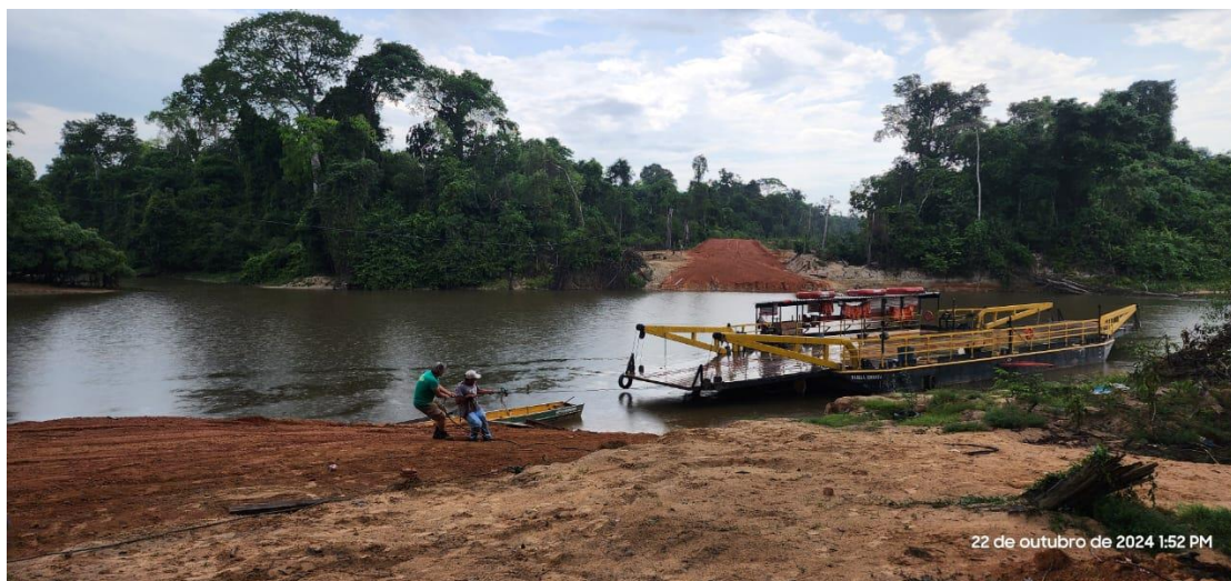
Foto 3 Travessia Nova Bandeirantes Jaci Paraná